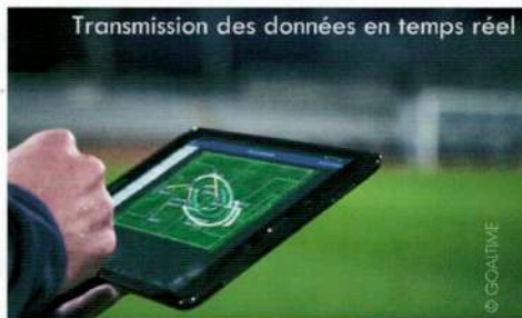
Transmission des données en temps réel