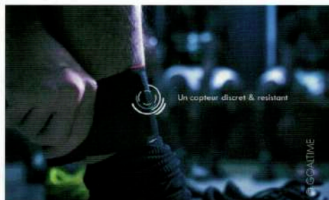
Un capteur discret & résistant