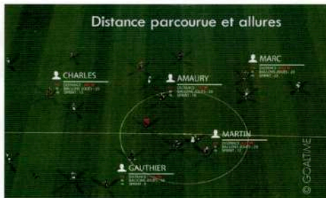
Distance parcourue et allures